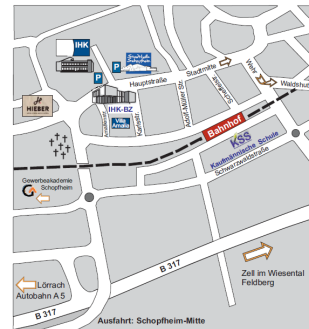
Anfahrtsweg IHK- Schopfheim

Parkmöglichkeiten (kostenpflichtig): an der Stadthalle Schopfheim gegenüber der IHK oder am fußläufig gut zu erreichenden Parkplatz am Bahnhof.